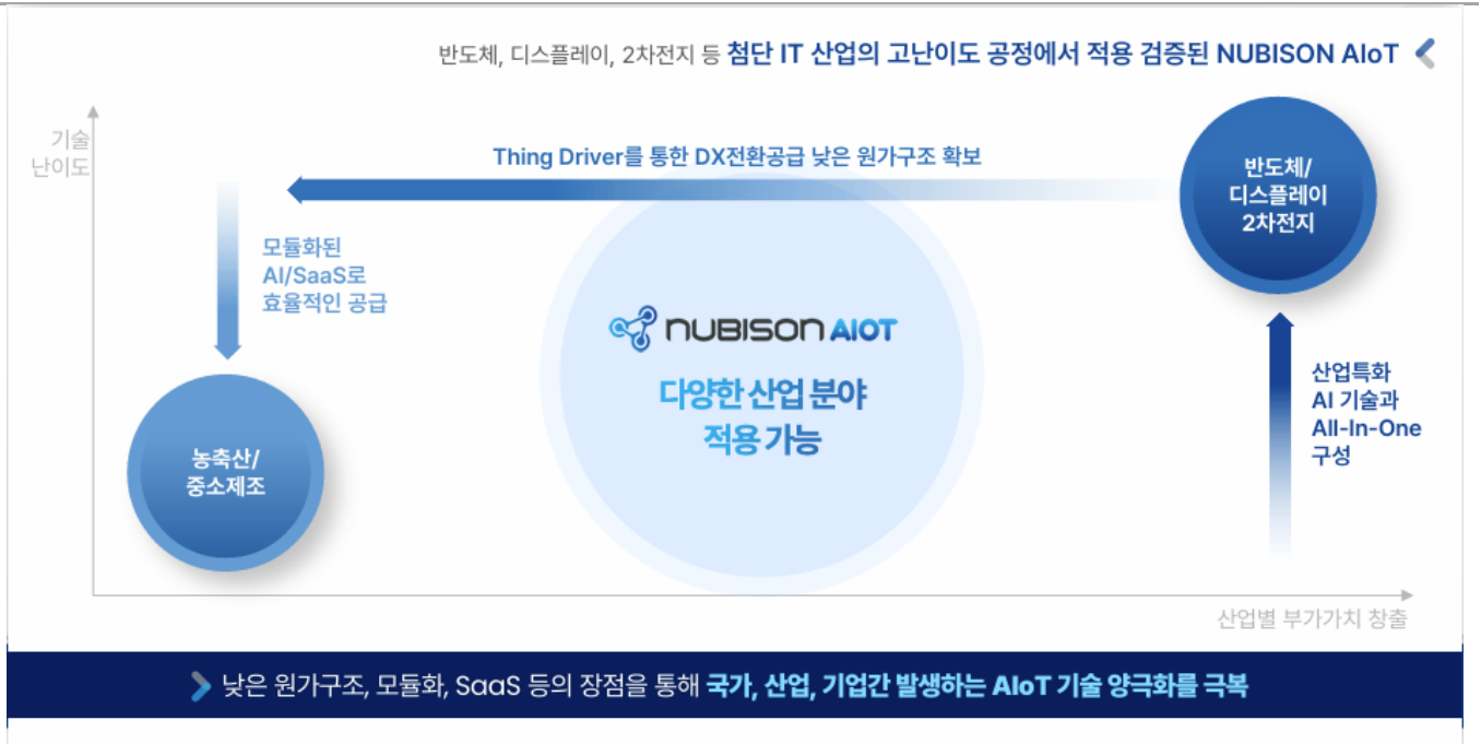
Figure 1. NUBISON AIOT 차별성