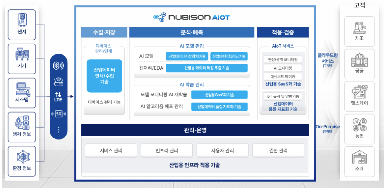
Figure 2. NUBISON AIOT 개요