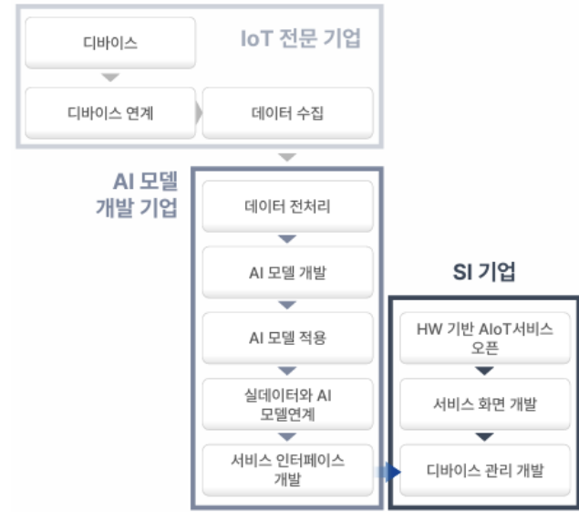
Figure 4. 기존 AIoT 적용 프로세스